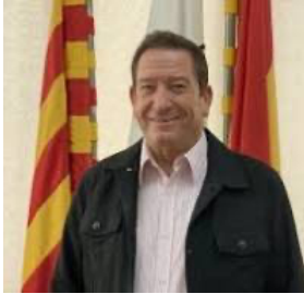
FINESTRA DEL PRESIDENT