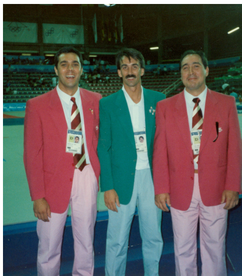
Jocs olímpics de Barcelona '92

L’any 1976 es va proclamar campió de Catalunya absolut, un dels moments més destacats de la seva trajectòria esportiva.