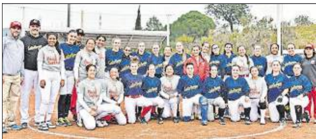
El conjunt peruà va aterrar a Barcelona el 15 de febrer