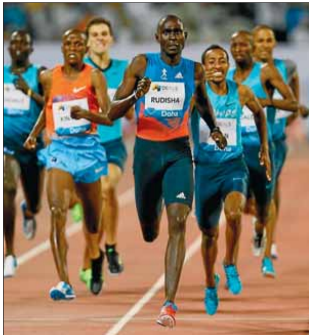
Rudisha supera Aman a Doha

La reunió es va iniciar amb força, i en les tres primeres proves el guanyador va fer la millor marca mundial de l'any. La croata Sandra Perkovic va ser la primera amb un llançament de 68,23 m en el disc en el seu últim intent, tot i que amb el primer de 67,37 ja havia superat l'anterior marca de l'any. En la llargada femenina la nord-americana Brittney Reese amb 7,25 (+1,6), va establir un bon registre en