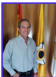
D. Juan Carlos Barcos Nagore Presidente de la Real Federación Española de Judo y D.A.

Espero que la competición concluya con el éxito esperado, en la que se encuentran el germen de los que serán a corto plazo nuestros representantes en los equipos nacionales de categorías superiores. Mi bienvenida a todos los participantes, aficionados y acompañantes con el deseo de que este campeonato sea un éxito deportivo y de organización y de que disfruten todos ustedes al máximo de la competición y hospitalidad de Leganés.